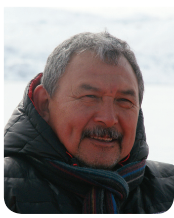
Rasmus Lyberth: Guitar, sang

Det kan kun blive STORT med den store stemme fra Grønland. Han fylder spillesteder til bristepunktet og begejstrer både publikum og anmeldere. Det er altid en betagende og helt enestående oplevelse at høre Rasmus Lyberth synge sine grønlandske sange. Rasmus besidder en ganske speciel evne til at formidle de dramatiske, storslåede og kontrastfyldte fortællinger, man kan møde i Grønlands natur og menneskeskæbner. Med sin selvkomponerede musik og sin fængslende stemme synger Rasmus, så det trodser alle sprogbarrierer og går lige i hjertet. Siden 1970'erne har han været et af landets mest populære ansigter. Med sin musik og kunst har han sat fokus på landet mod nord hos et internationalt publikum, og hans engagement har sikret Grønland en af de mest populære, kunstneriske repræsentanter nogensinde. Rasmus Lyberth har optrådt i hele verdenen og har modtaget et hav af priser. I 2011 var han indbudt af BBC til at optræde i Royal Albert Hall i London. Entré: 120/160/U25: 120